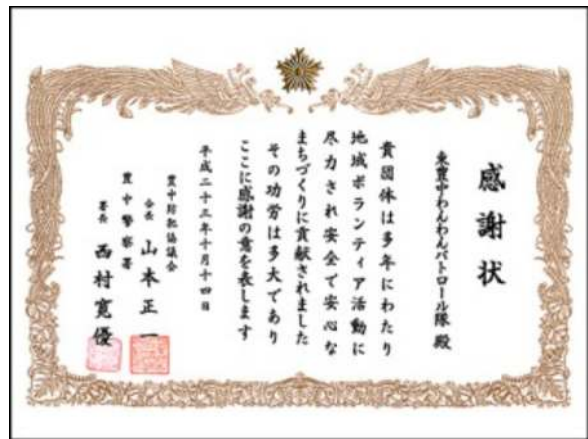
『とよなか地域安全大会』で表彰されました！ 大会の様子と感謝状（豊中警察・豊中防犯協議会より）